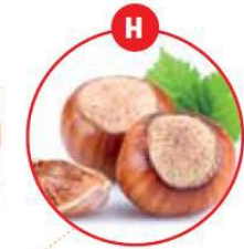
H SCHALENFRÜCHTE UND DARAUS GEWONNENE ERZEUGNISSE