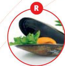
R WEICHTIERE WIE SCHNECKEN, MUSCHELN, TINTENFISCHE UND DARAUS GEWONNENE ERZEUGNISSE