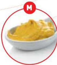
M SENF UND DARAUS GEWONNENE ERZEUGNISSE