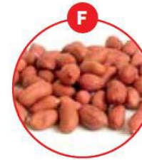
F SOJABOHNEN UND DARAUS GEWONNENE ERZEUGNISSE