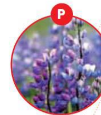
P LUPINEN UND DARAUS GEWONNENE ERZEUGNISSE