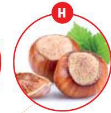
H SCHALENFRÜCHTE UND DARAUS GEWONNENE ERZEUGNISSE