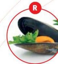
R WEICHTIERE WIE SCHNECKEN, MUSCHELN, TINTENFISCHE UND DARAUS GEWONNENE ERZEUGNISSE