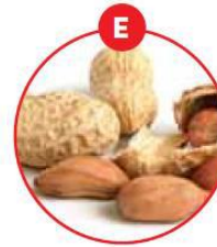
E ERDNÜSSE UND DARAUS GEWONNENE ERZEUGNISSE