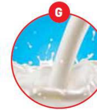
G MILCH VON SÄUGETIEREN UND MILCHERZEUGNISSE (INKLUSIVE LAKTOSE)