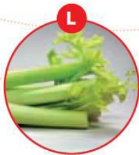
L SELLERIE UND DARAUS GEWONNENE ERZEUGNISSE