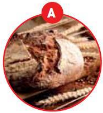
A GLUTENHALTIGES GETREIDE UND DARAUS GEWONNENE ERZEUGNISSE