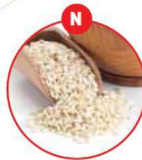
N SESAMSAMEN UND DARAUS GEWONNENE ERZEUGNISSE