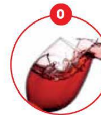
O SCHWEFELDIOXID UND SULFITE