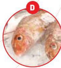
D FISCH UND DARAUS GEWONNENE ERZEUGNISSE